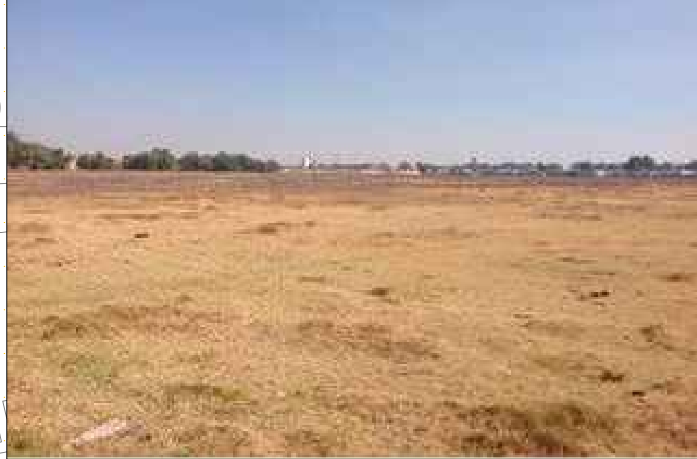
F1: Condicionante topográfica del predio (sempi plano)

Presenta una pendiente semiplana, misma que facilita la introducción de los servicios y el desarrollo de vivienda.